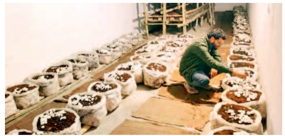
जिले में मशरूम की खेती करने वाले युवाओं की संख्या बढ़ रही। ग्रामीण क्षेत्रों में इसे लेकर खासा उत्साह है।

प्रशिक्षण से बढ़ा रहे जागरूकता वे केवल स्वयं तक सीमित नहीं रहे, बल्कि कई किसानों और युवाओं को मशरूम उत्पादन का प्रशिक्षण भी दे रहे हैं। इससे ग्रामीण क्षेत्रों में स्वरोजगार के नए अवसर उत्पन्न हो रहे हैं और युवा आत्मनिर्भर बनने की दिशा में आगे बढ़ रहे हैं।